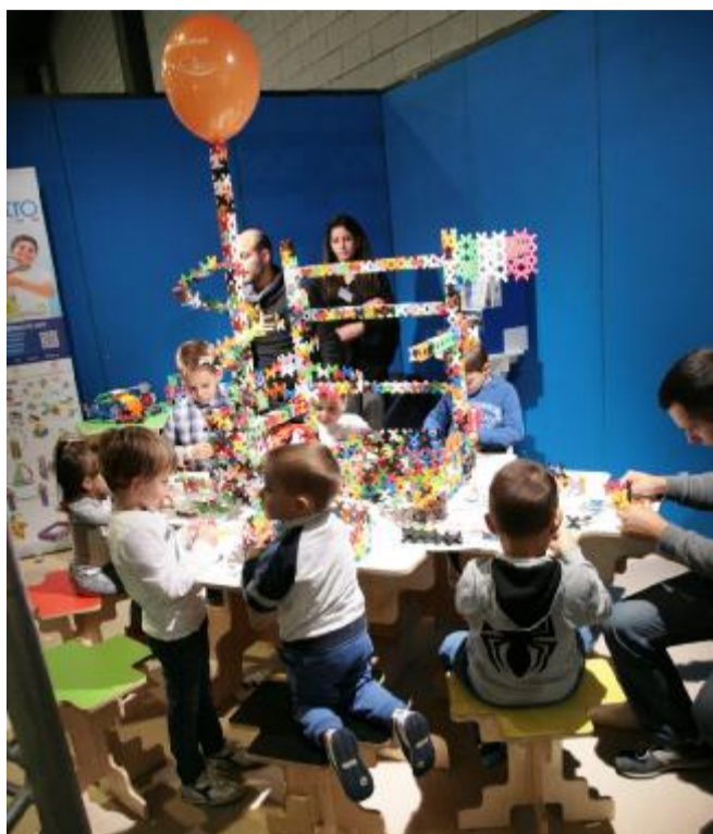
Colori e fantasia alla fiera Children and family